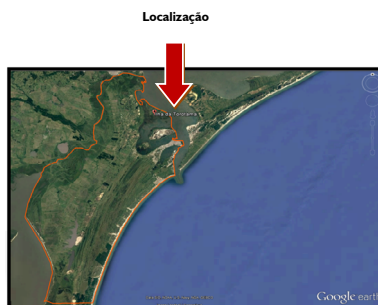
Figura 2 - Localização da Ilha

As terras em que hoje vivem diversos(as) pescadores(as) já foram ocupadas por populações indígenas há séculos. Foi no século XVII que chegaram os primeiros colonizadores portugueses e os jesuítas espanhóis na Ilha de Torotama, e após períodos de disputa pelo território, os portugueses acabaram ven-