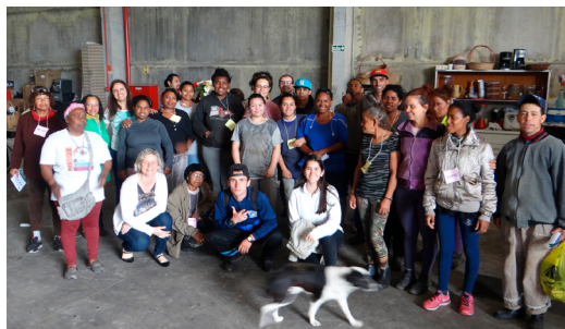
Figura 5 - Cooperativa de Reciclagem Santa Rita recebe extensionistas do Projeto LAM para formação sobre Política Ambiental Municipal

Além da geração de trabalho e renda o grupo desenvolve atividades nas áreas sociais, tais como: projeto de produção de sabão e sabonete com os(as) filhos(as) dos cooperados ao longo do ano de 2016; projeto escolinha para os(as) cooperados(as), desenvolvido em parceria com a FURG; e projeto de rodas de conversas com as mães, em parceria com a Pastoral da Criança - os dois últimos em vigência até o momento. Desde 2019 a Cooperativa tem cadeira no Conselho Municipal de Meio Ambiente (COMDEMA) como representante da Sociedade Civil Organizada.