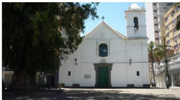
Figura 9 - Catedral de São Pedro, Igreja mais antiga do Estado, construída em 1755 em estilo barroco SILVA (2010).