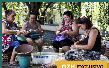
Figura 3 - Mulheres da Torotama

“Retirado da laguna dos Patos, o crustáceo tem preço até cinco vezes menor do que o camarão. E é mais difícil de ser selecionado. Um trabalho penoso, como costumam dizer as mulheres da Torotama. Para se obter um quilo de carne, é preciso descascar 50 siris. Mas a função que atravessa gerações começou a ser vista de outra forma a partir de 2016, quando uma professora da escola municipal Cristóvão Pereira de Abreu, única instituição de Ensino Fundamental da região, propôs aos estudantes contarem as histórias das sirizeiras. Deu tão certo, que o projeto acabou envolvendo toda a escola. No final de 2017, a ação foi premiada nacionalmente.”