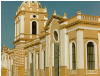
Figura 15 - O prédio da Antiga Alfândega construída em 1875 e terminada em 1879 em estilo neoclássico. Atualmente serve de sede ao Museu da Cidade - Tombado como Patrimônio Histórico Nacional (SILVA, 2010).