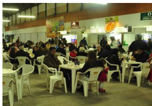
Figura 23 - Festa FEARG