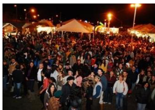
Figura 24 - Festa Fejunca

A Festa da Fejunca (Festa Junina do Balneário Cassino) é uma Festa Tradicional no município de Rio Grande que geralmente sempre conta com diversas atrações como: bancas de gastronomia típica, bancas de artesanato, apresentações de músicas e danças locais entre outras atrações.