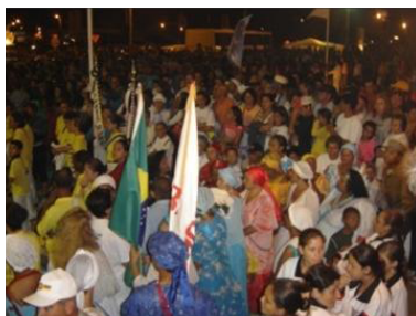
Figura 19 - Noite de Iemanjá

Segundo esses autores o reconhecimento político da festa em Rio Grande e em São José do Norte é um demonstrativo da vitalidade da mesma e da mobilização popular, considerando os registros de que, ao menos nos últimos cinquenta anos, milhares de pessoas comparecem às praias com diferentes objetivos que englobam desde demonstração de fé até desenvolvimento de atividades comerciais.