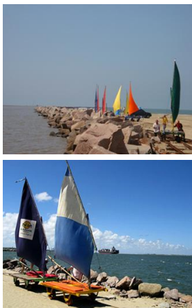
Figura 18 - Vagoneta

A atividade pesqueira é considerada um patrimônio cultural imaterial da cidade de Rio Grande. Culturalmente existem datas específicas no ano em que são realizadas festas relacionadas a temática da pesca e do(a) pescador(a) na cidade.