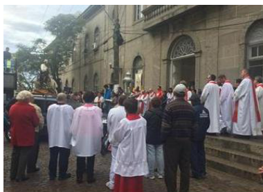
Figura 21 - Festa de de São Pedro e do Pescador (Momento da Procissão)

A festividade geralmente conta com a parceria das Associações de Pescadores de Rio Grande.