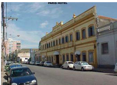
Figura 17 - Hotel Paris, datado de 1826, tombado em 1986, funciona como a casa de armador de navios (SILVA, 2010).