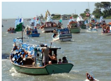
Figura 20 - Dia de Navegantes