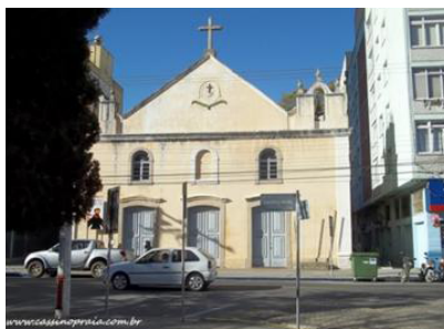
Figura 12 - A capela de ordem terceira de São Francisco, construída em 1772, pelo Brigadeiro Rafael Pinto Bandeira e doada a comunidade em 1797, conhecida como "igreja dos negros e escravos" (SILVA, 2010).