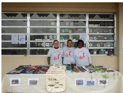
Figura 8 - Grupo de Artesãs da Barra

menda de clientes, como a Fundação Pró-Tamar e a Superintendência do Porto do Rio Grande. Também são elaboradas peças para comercialização em feiras e pontos de vendas localizados no Museu Oceanográfico da FURG e na sede do NEMA, situada no Cassino (GRUPO ARTESAS DA BARRA, 2019)