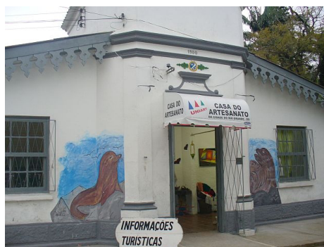
Figura 6 - Casa do Artesanato

O Núcleo de Artesanato de Rio Grande - UNIART é responsável por esse espaço que fica localizado na Praça Tamandaré. Além da comercialização dos produtos artesanais, esse núcleo organiza e realiza propostas de aprendizagem, formação e capacitação. As artesãs e artesãos desse núcleo produzem peças temáticas que contribuem para que o espaço seja um ponto turístico da cidade.