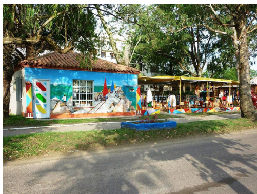
Figura 7 - Associação dos Artesãos e Artistas do Rio Grande

2009, um grupo de artesãos de diversas áreas, voltaram a se organizar, realizando eleições, na esperança de juntos contribuírem com melhores condições de trabalho na área da cultura e do artesanato. Hoje conquistaram um espaço na avenida Rio Grande no Cassino, onde foi instalada a Casa do Artesão da associação, local onde ocorre exposições contínuas do artesanato local.