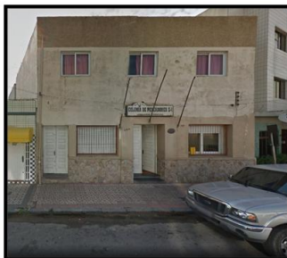
Figura 4 - Colônia de pescadores Z1, Rua Dezenove de Fevereiro, 588 - Centro - Rio Grande, RS

O presidente, ainda afirmou que os principais serviços oferecidos aos pescadores e pescadoras são: