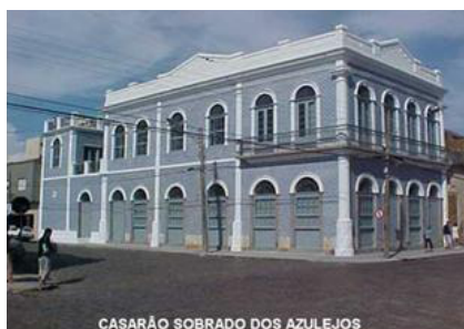
Figura 14 - O Sobrado dos Azulejos é o único sobrado urbano do século XIX, em estilo neoclássico e todo revestido de azulejos portugueses da região Sul do País (SILVA, 2010).