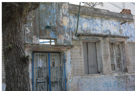
Figura 11 - Clube Recreativo Braço é braço: Fundado em 1920 simboliza a cultura e resistência negra na cidade de Rio Grande e que se manteve em funcionamento até meados de 2000 (CRUZ, 2014).