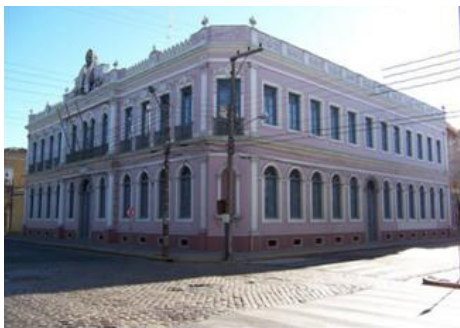
Figura 10 - Antigo quartel-general em estilo eclético datado de 1894 (SILVA, 2010)